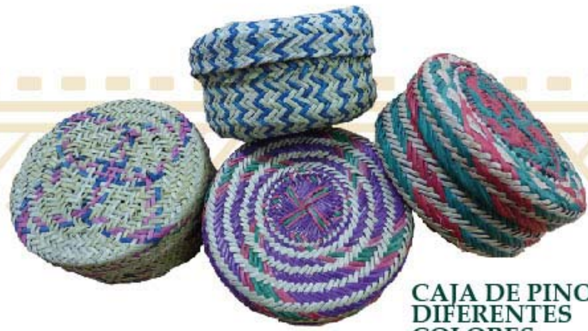
CAJA DE PINO DIFERENTES COLORES $60