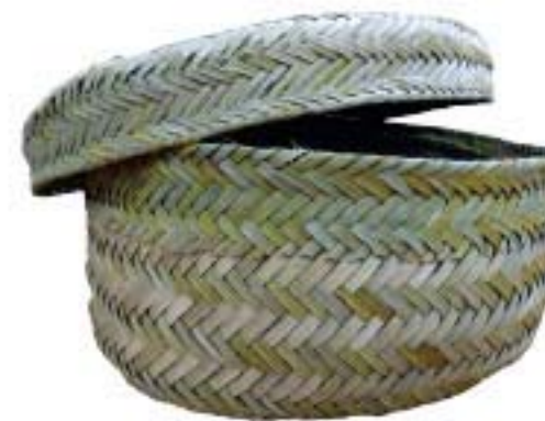
PETACA DE PALMILLA CH $160