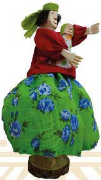
MUÑECA DE MADERA $70