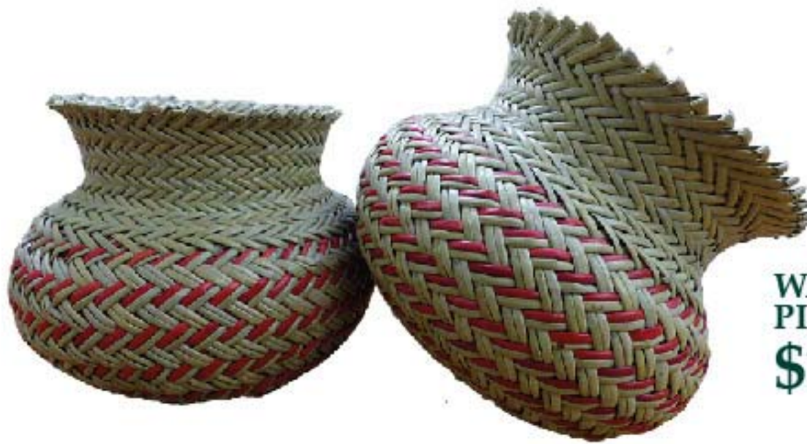
WARE PINO DOBLE $110