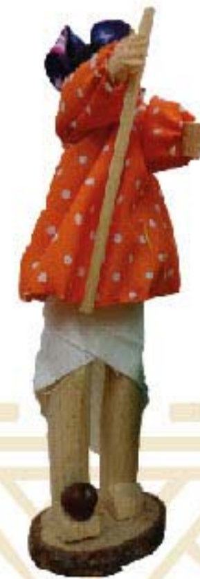
MUÑECO DE MADERA ARQUERO $80