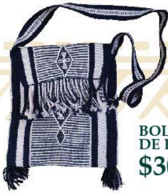
BOLSA DE ESTAMBRE $300