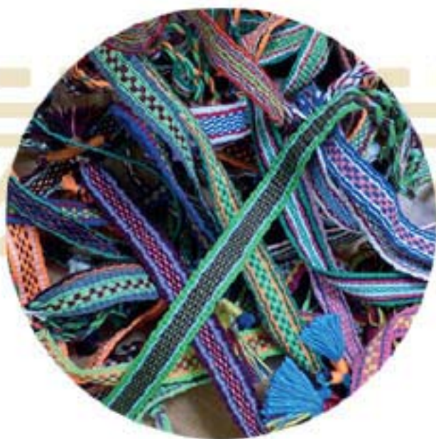
PULSERA DE HILO SENCILLA $30