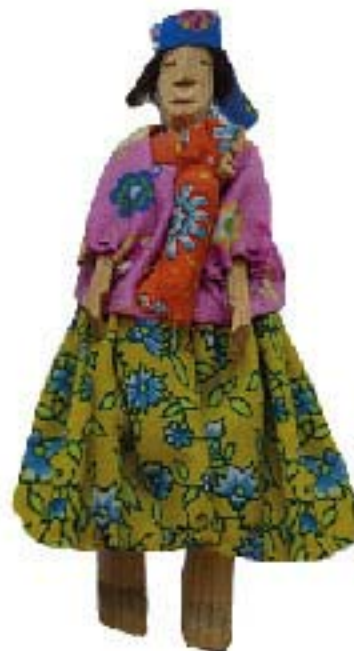
MUÑECO DE MADERA CORREDOR $80