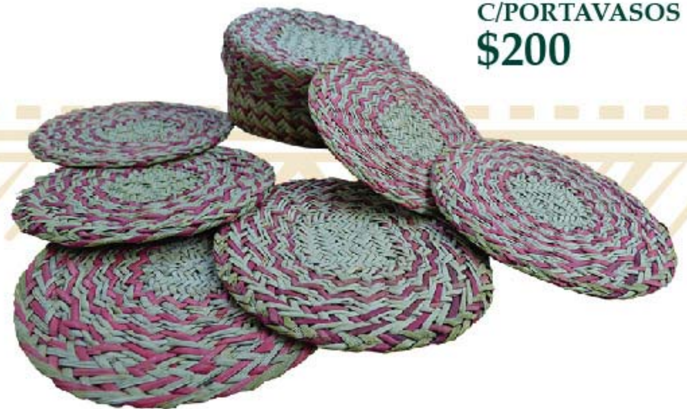
WARITO C/PORTAVASOS $200