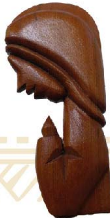
VIRGEN DE CHINATÚ (BUSTO) $120