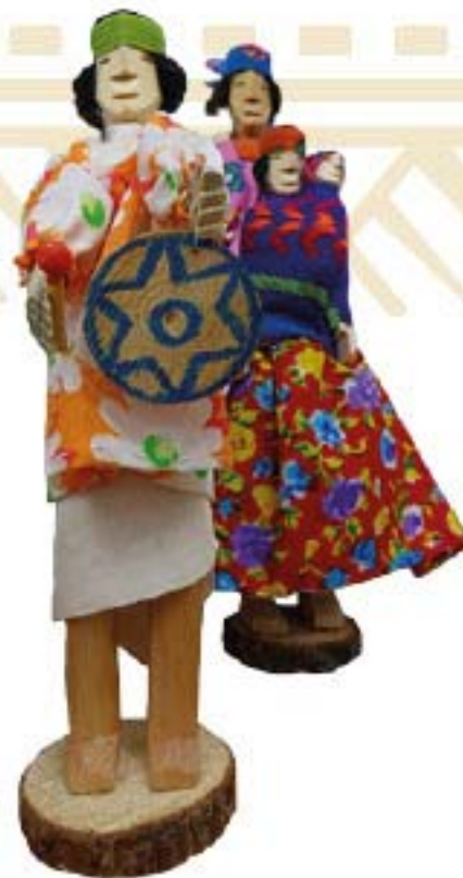
MUÑECO DE MADERA C/TAMBOR $80