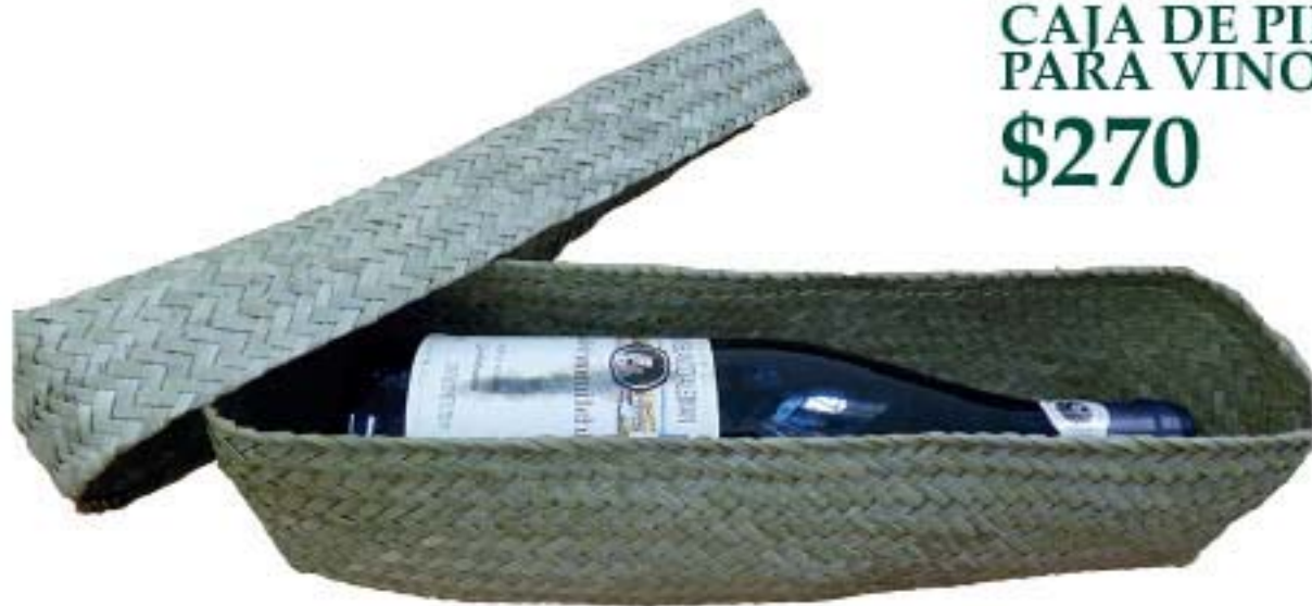
CAJA DE PINO PARA VINO $270