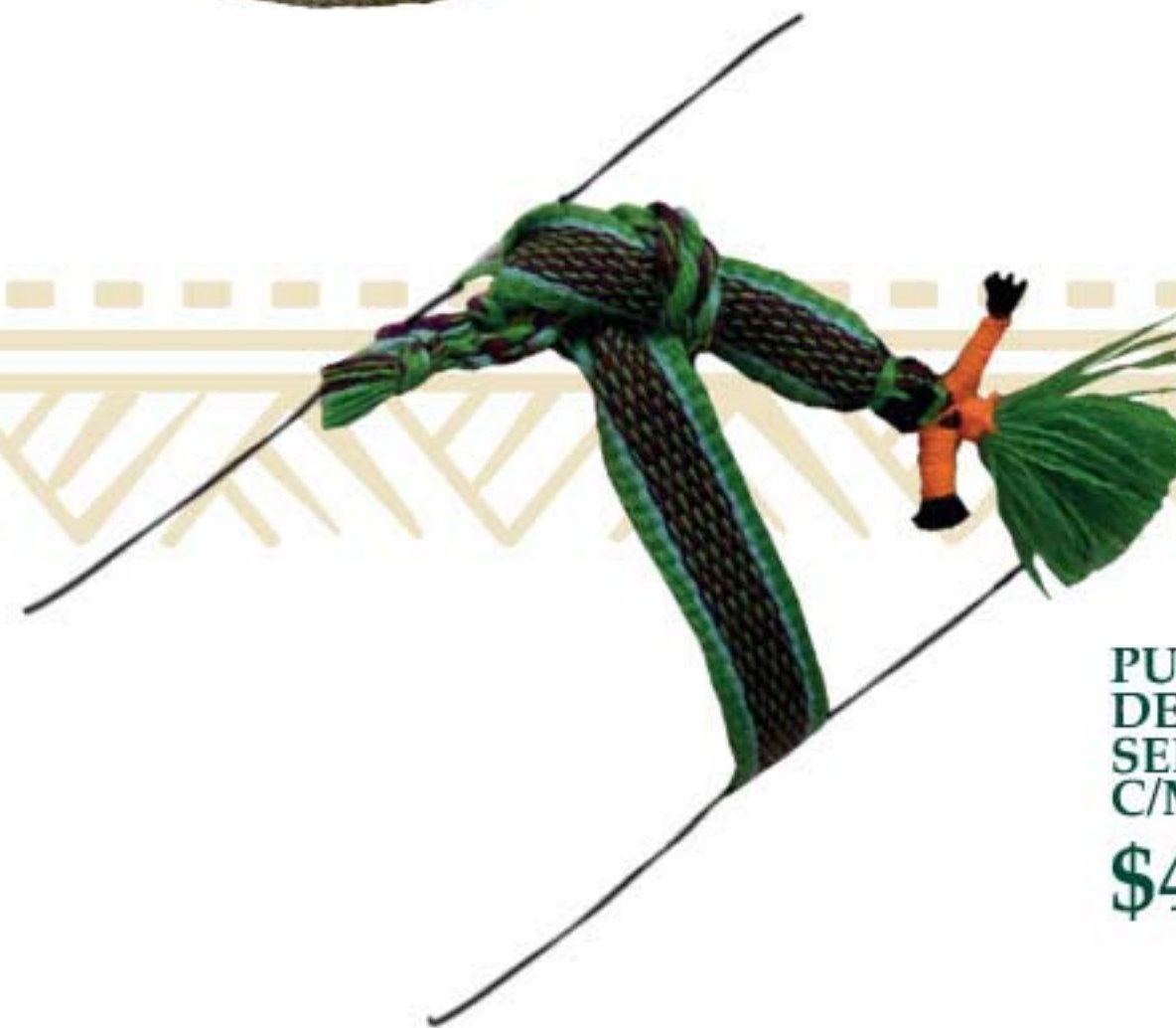
PULSERA DE HILO SENCILLA C/MUNECO $40