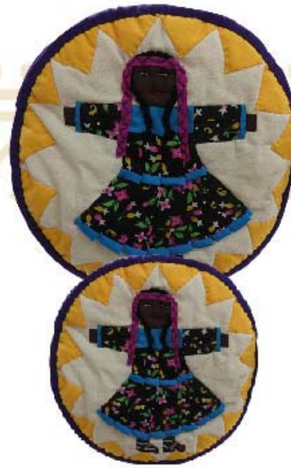
TORTILLERO DE MANTA M $190