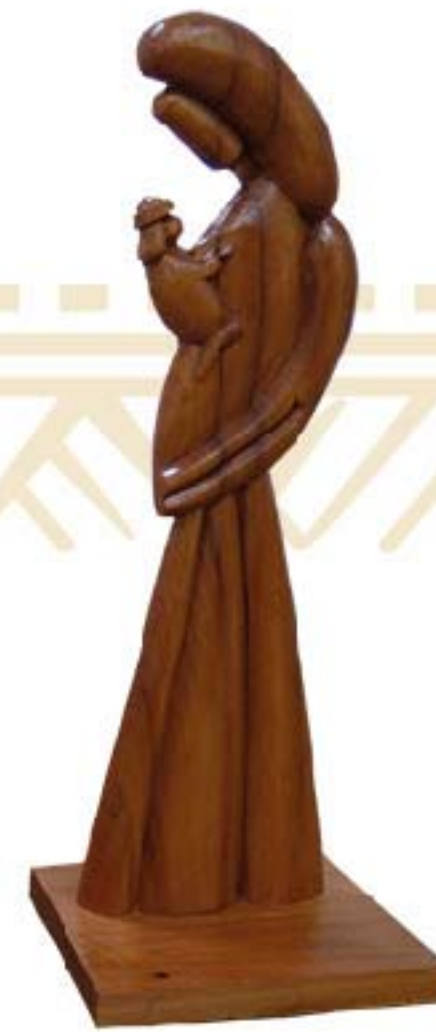
VIRGEN DE CHINATU C/NINO $130