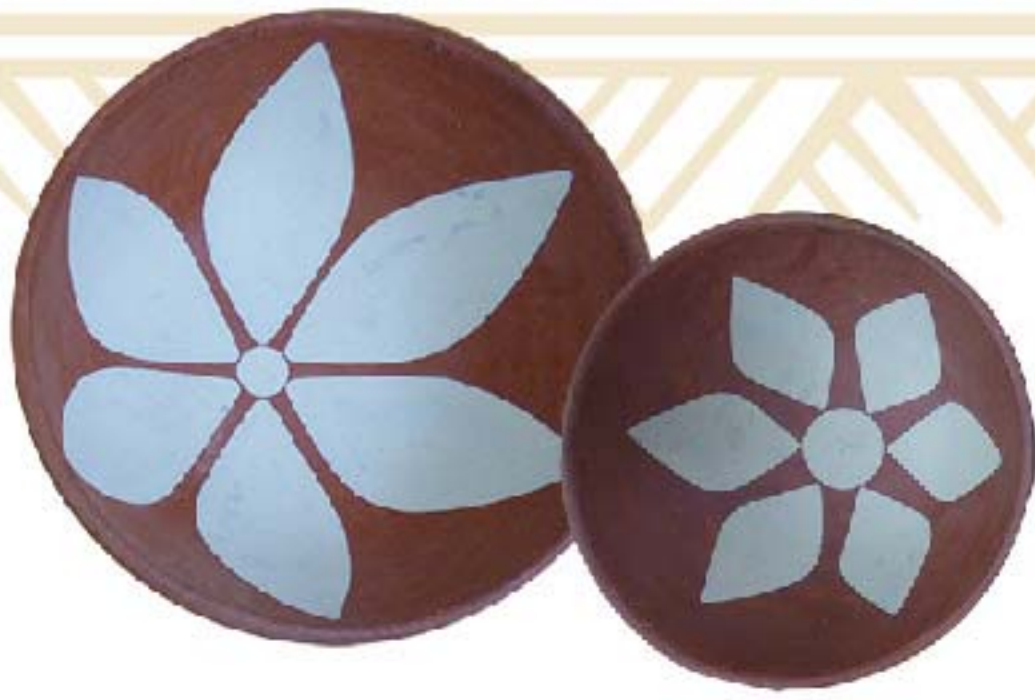
PLATO DE BARRO M $70