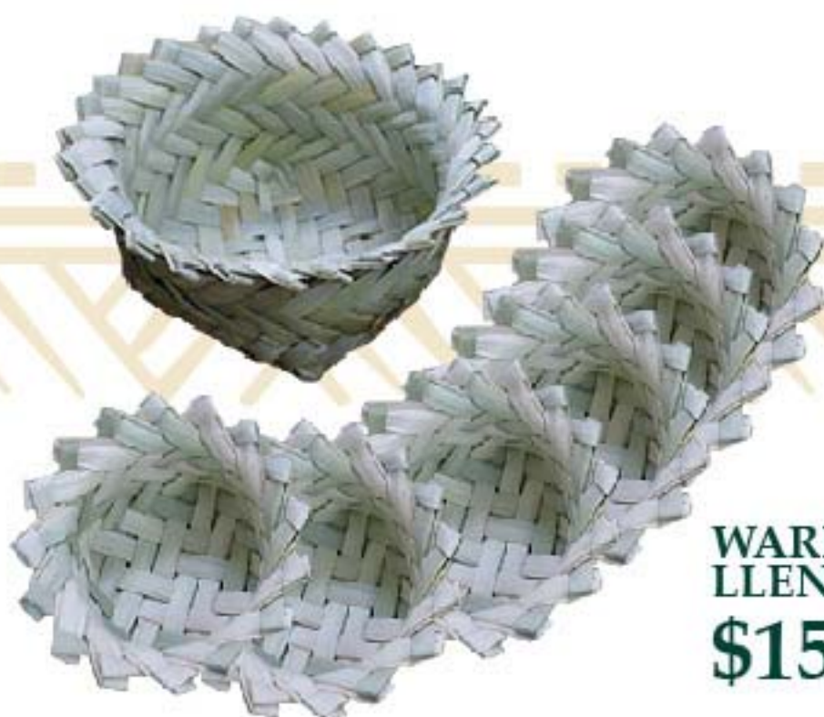
WARITO LLENITO SOTOL $150